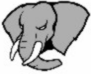
Resim 1. Slon, Slony maskotu.

Slony Rusca cogul fil anlamına gelen bir sozcuk olması yanında Jan Weick tarafından sürdürülen bir cogaltma projesinin ismidir. Slony için kullanılan maskot, Slon, ise Postgres için kullanılan fil maskotunun değişik bir varyasyonu.